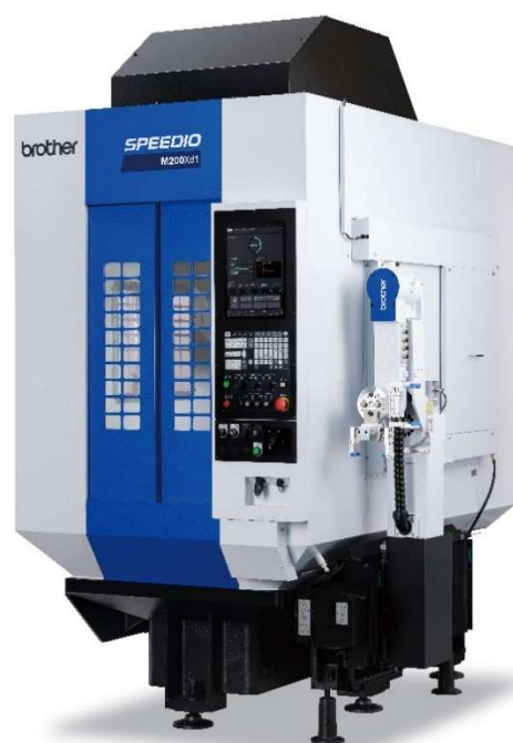
M200Xd1 機台搭載 BV7Ad