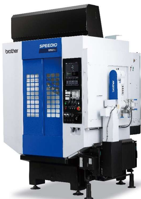
S500Xd1 機台搭載 BV7Ad